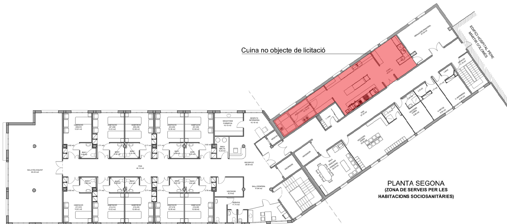
PLANTA SEGONA (ZONA DE SERVEIS PER LES HABITACIONS SOCIOSANITÀRIES)